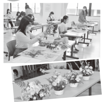
きれいな花から新しい価値を生み出すアートに挑戦