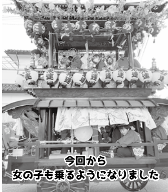
今回から 女の子も乗るようになりました