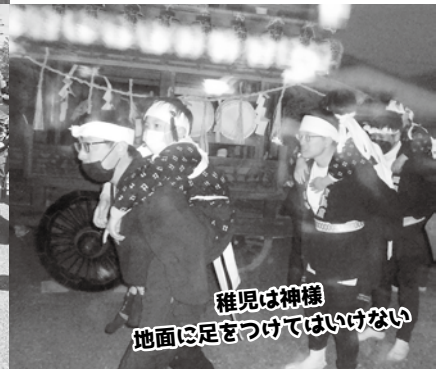
稚児は神様 地面に足をつけてはいけない