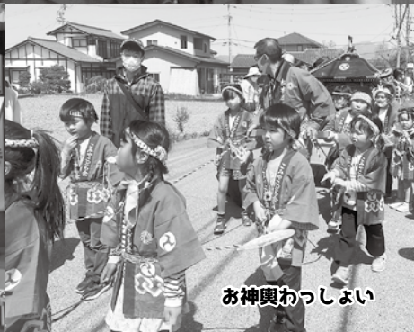
お神輿わっしょい