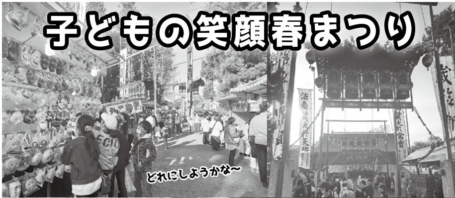
どれにしようかな～