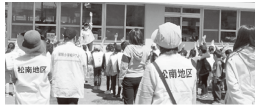
幼・老が相和し、地域が担う学校の大きなスティージの一つ。PTAとの連携など新たな方途を探る時期でしょう (白澤 幸男)