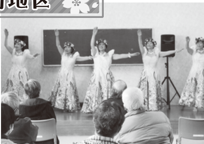
春を呼ぶフラダンス(双葉町)