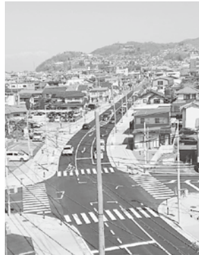
【館報編集委員 宮城】

このほど新たに「渚橋東」信号が稼働しました。こうして高いところから見ると、きれいに整備された道路とともに、近くの城山公園とはるか遠くに臨む北アルプスの山並みが美しいですね。