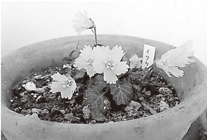
釣鐘のように下向きに咲く花

は水やりに注意のこと。名前の由来は葉の形がウチワに似ているところから命名されました。葉の質は厚く光沢の良い葉、淡紅色で下向きに咲く釣鐘状の花、共に観賞する価値があります。花茎は5センチ〜8センチ、その先に1個の花を付けます。名前の示す通り岩場の厳しい場所で育つ丈夫な植物です。山野草の愛好家が好む植物、是非、仲間に加え楽しんでください。