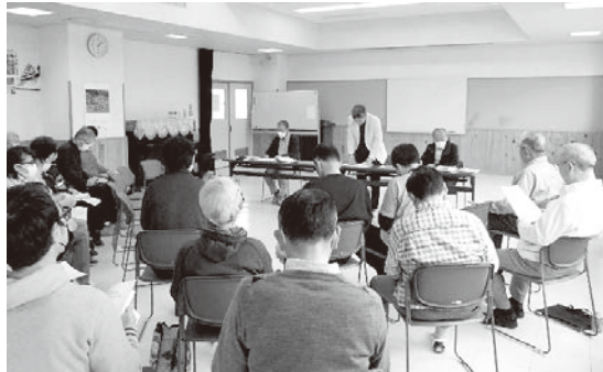
第一回「天白三町会」定期総会 (R5. 4.16)