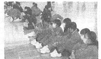
クラスの男子を応援する女子