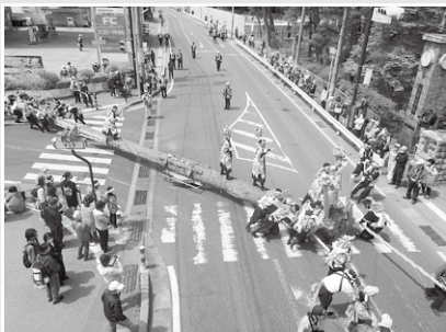
三之御柱 (波田小学校前)