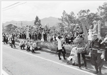
三之御柱 (子ども木遣り)