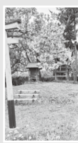
島立堀米の裸祭り