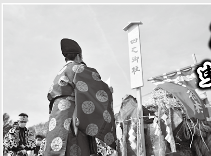
曳行前の神事 (四之御柱)