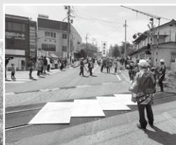
踏切通過 (二之御柱)