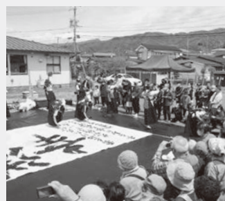
書道パフォーマンスと大勢の参加者

令和5年4月14～16日、寿台町会連合会は、50周年記念式典と恒例の桜寿祭を合わせて開催しました。今年度計画されている記念イベントの第1弾です。寿台体育館ふれあいセンター、福祉ひろばなど、地区スタッフが入念に準備した各会場に多くの住民が集い楽しみました。