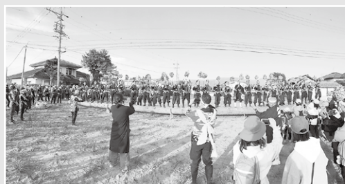
二之御柱 (青年全員木遣り)