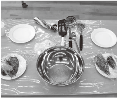
テーブルにそろえた食材や道具

地域内の子どもが誰でも利用できる取組み、同一施設での所定の時間・回数の実施毎回の食事提供、子どもの学習支援や保護者の生活相談など満たすべき要件があります。令和2年度以降、9団体から8団体増え、現在17団体が支援を受けています。