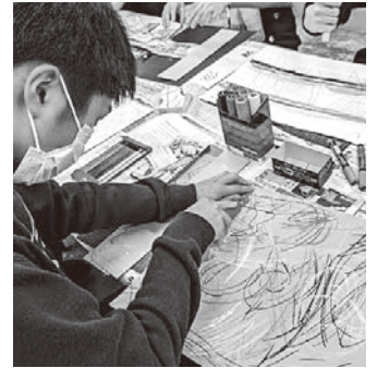
世界にひとつだけの本づくり