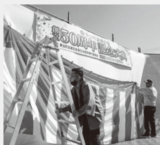
前日の雨の中組み立てた骨組みに当日朝から準備する地区スタッフ

今回も桜寿祭の「ワクワク子ども広場」は、親世代、子ども世代のきずなを深めようと、若い住民で構成される壮年会と育成会が企画しました。また、ウォークスタン