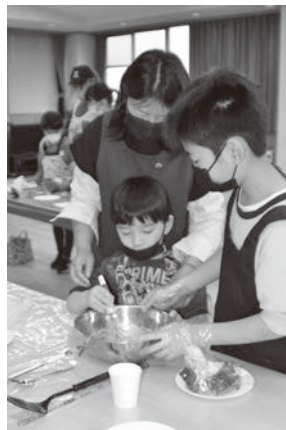
親子仲良く力を合わせ

お話スタッフと遊んでいる間に、薄皮が焼き上がります。あんこを包むとさくら餅の完成です。初めて作って上手くいった！皮がくっついたけれどあんこが美味しい！など、たくさんのはしゃぎ声が響いていました。最後に帰りの会をして解散となりました。