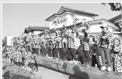
四之御柱 (子ども木遣り)