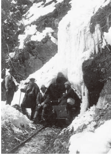
昭和2年 完成したころの様子 開村130年のあゆみ旧安曇村編纂より転載

釜トンネルは、大正池の水を霞沢発電所に送るための、送水管を運ぶ目的で作られた。工事終了後は道路用に整備され、昭和8年に大正池までバスの運行が始まった。