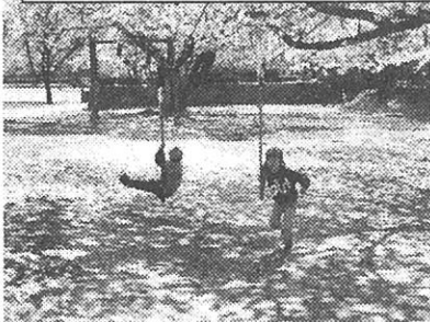
楽しみにしていた ターザンロープ