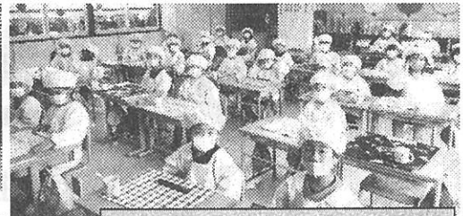
給食の準備は、ばっちり！

1年生も給食が始まり、みんなと同じ時間で下校する日常を送るようになりました。どれも初めてのことで、毎日がドキドキ・ワクワク。先生と一つ一つ丁寧に覚えています。楽しい遊び場や素敵な場所を見つけた子も多いようで、遊びに誘ってくれる6年生とも仲良く関わる姿も増えています。