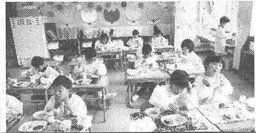
初めての給食、とってもおいしいよ！