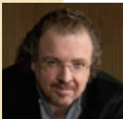
ステファン・ドゥナーヴ