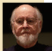
ジョン・ウィリアムズ