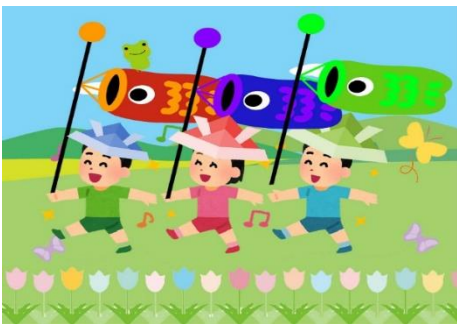
以前の幼児教育（イメージ）

幼児教育は大きく変わってきています。今日の前にいるお子さんが成人する頃には私たちが過ごしたことのない社会になっているかもしれません。どのような時代になってもあゆみ続けられるためにも必要と言われる 非認知能力 。例えば、主体性、集中力、忍耐力、勇気、やり抜く力。。。。数値では測れないけれど、「生きる力」とも言うべき能力です。しかし、 認知能力 を身につけることも大切です。信学会が大切にしてきた伝統ある活動なども行いながら、「自ら考え行動する」「自分の気持ちを表現する」などの時間をより多く取り入れ「子どもが真ん中」の保育をすすめていきます。考え行動する時間の確保を重視したり、クラスの子どもに合わせた環境づくりをするので例年通りではない、また、クラスにより活動内容が異なることもあるかもしれません。過程や手段は異なっても、願いは同じです。今まで同様温かく見守っていただけるとありがたいです。