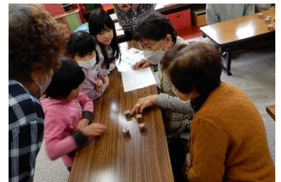
↑3/24に福祉ひろばと共催で地域の皆さんとのふれあひ交流会を行いました！