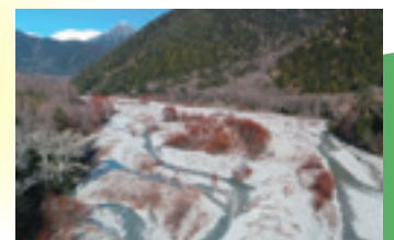
再生後のイメージ（網状流路）

管理用道路の再整備を通して、人為的に改変された梓川を本来の自然な流れ「網状流路」に再生するとともに、より安全な利用環境を整えます。詳細は、市ホームページをご覧ください。