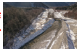
現在の管理用道路

徳沢、横尾地区の管理用道路は、山小屋や公衆トイレの維持、傷病者の搬送等のために必要です。しかし、現在の道路は、川の中に設置されているため、自然環境や景観の阻害、出水時の安全確保といった課題を抱えています。