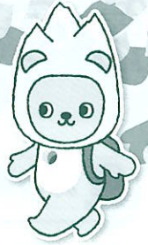
長野県PRキャラクター 「アルクマ」 ©長野県アルクマ