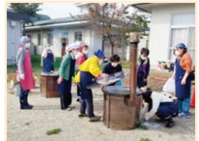
松本市内の日赤奉仕団による炊き出し （ボランティア活動の推進）