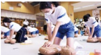
心肺蘇生を学ぶ中学生

地震や豪雨等の災害が発生した場合、医療救護班の派遣・救援物資の配布等さまざまな支援活動を行います。