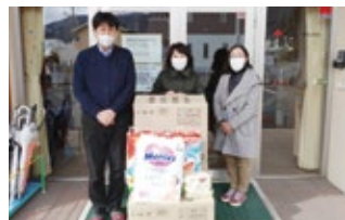
乳児院へのオムツ等寄贈の様子

県内各市町村に組織される地域奉仕団や概ね 18～30 歳の社会人や学生が所属する青年奉仕団、専門知識・技術を持つ特殊奉仕団が様々なボランティア活動に取り組んでいます。