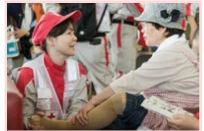
被災者に寄り添う赤十字救護班 （災害から「いのちを救う」活動）

松本市における赤十字活動は、分区（各地区・町会）や赤十字奉仕団の皆さまのご協力により、成り立っています。