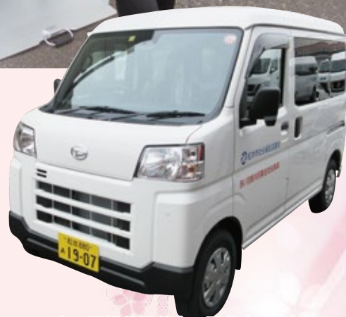
赤い羽根共同募金の配分金により 新しい福祉車両が入りました

今年度、新しい車両も入りました！貸し出しを希望される方は、お気軽にご相談ください。（※福祉車両の燃料費などご利用者の負担となります。）