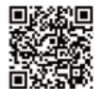
ひろば公式ライン