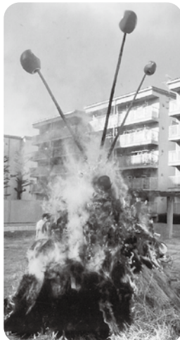
●燃え盛る!双葉西・南

コロナ発生により各小学校PTA支部が伝統行事である三九郎という新年の大事な催しが出来ずに参りました。しかし本年は完全とはならないものの、町会が何とか応援しつつ三九郎を挙行できました。しかし、「お焚き上げ方式」だったり、本来通りとは程遠く伝統行事が子どもたちに継承していけるか、松南地区のみならず、各地区各町会が試されていると思います。地区の役員、大人がしっかりとこのから踏ん張っていかないと、繋いでいく体制が出来ません。「青山様・ほんぼん」も含め、課題が多い伝統行事の実態です。(百瀬壽)