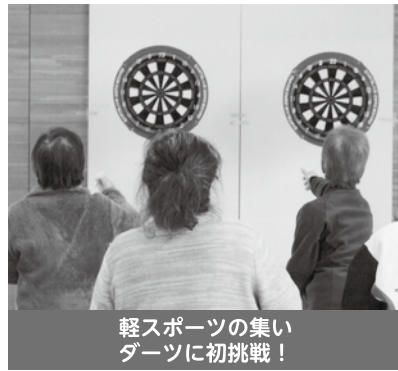
軽スポーツの集い ダーツに初挑戦!