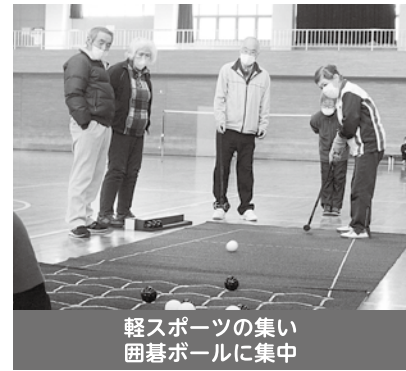
軽スポーツの集い 囲碁ボールに集中