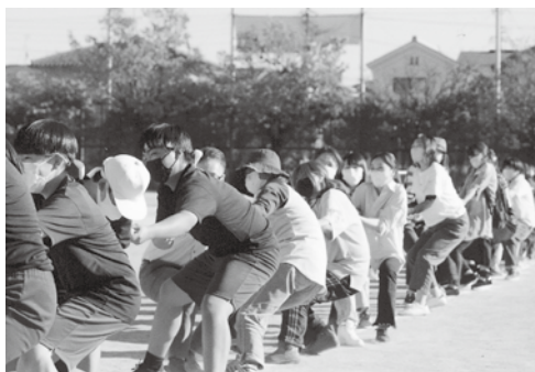
絶やしてならぬ!親子綱引き大会

綱引きの裏方を務めた「親父の会」も忘れられませんが、子どもを支える絆を編んでいたのです。たかが綱引き、されど綱引きなのです。(近藤晴彦)