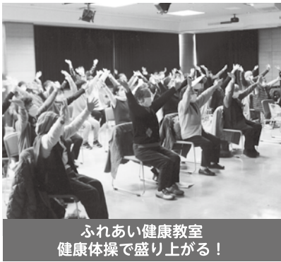
ふれあい健康教室 健康体操で盛り上がる!