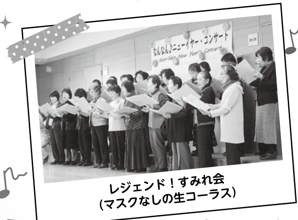
レジェンド!すみれ会 (マスクなしの生コーラス)