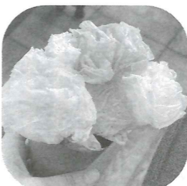
工作学習会で作った花ブーケ