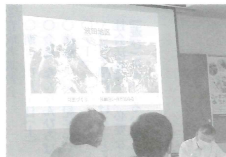
波田地区子ども会の発表