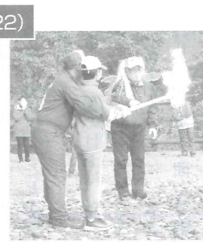
火の神から火をもらう