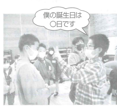
アイスブレイク無言パースデー