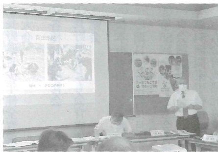
岡田地区子ども会の発表

最後の育成会副会長のお礼の言葉の中で、コロナだからやめようではなく、なんとかできるような努力して経験を積ませたいというのが、出席者全員の思いであったと思います。