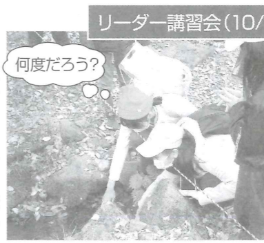
ポイントラリー 水温あて