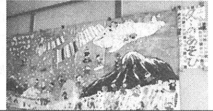
プレハブ校舎昇降口掲示(あずさ学級)

今日で3学期の学校生活が終わりました。1年生から5年生にとっては、それぞれの学年教育課程の修了となります。本日、通知表をお渡ししました。最後のページには、修了した証として校長印が押されています。お子さんの1年間のがんばりを振り返っていただくとありがたいです。なお、1日早く春休みとなりますが、修了証の期日は3月16日となっています。ご了承ください。