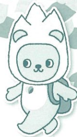
長野県PRキャラクター 「アルマキ」 ©長野県アルマキ