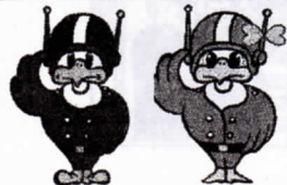
長野県警察シンボルマスコット「ライボくん ライビィちゃん」