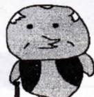
特殊詐欺被害防止キャラクター