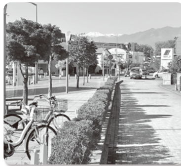
▲松本駅アルプス口