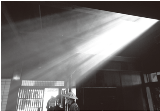
▶脇本陣奥谷室内にて、窓から差し込む光

この日は天気恵まれ、澄み渡る青い空が広がり、バスからは赤や黄色、色とりどりに紅葉し山々の間から力強い御嶽山が見え、現地に着く前から参加者の方々の心を躍ら