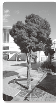
▲松本駅アルプス口