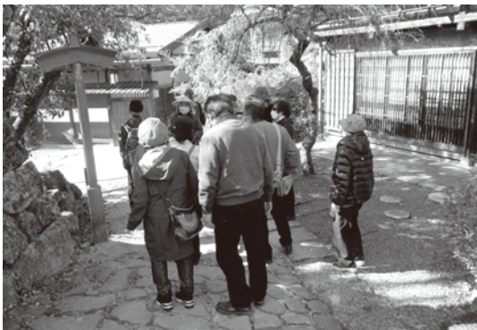
▶ガイドさんから宿場の成り立ちについての説明