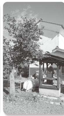
▲松本ガス東側駐車場