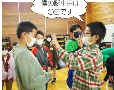
アイスブレイク無言パースデー