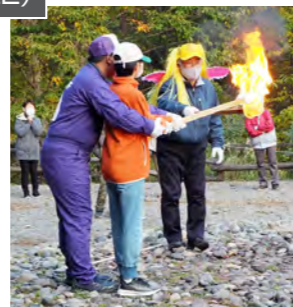
火の神から火をもらおう