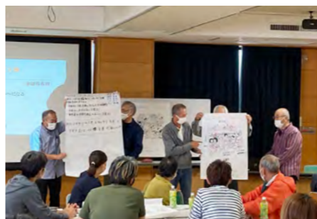
各グループの発表の様子

「子ども会活動中のバス移動」や「三九郎」というテーマで意見交換を行い、実際の活動の中で何に注意すればよいかを確認しました。