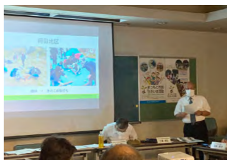
岡田地区子ども会の発表

校長会からは、コロナ禍での学校の活動状況の説明の後、判断に迷うことが多いが、子どもたちの学びを止めずに、この時にしかできない経験を積ませたいという希望と子ども会への活動に期待しているとの話が出ました。次に市PTA連合会より、