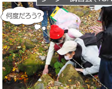
ポイントラリー 水温あて