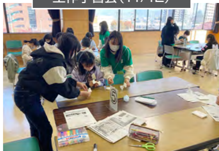
事後研修会 工作学習会と活動発表会