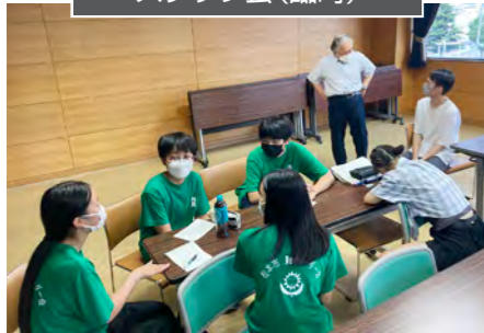
スタッフ会で計画して