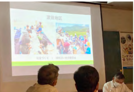
波田地区子ども会の発表