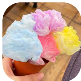
工作学習会で作った花ブーケ