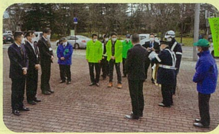
管内の小学校児童に配付する「反射キーホルダー」の贈呈式を実施した。(軽井沢)