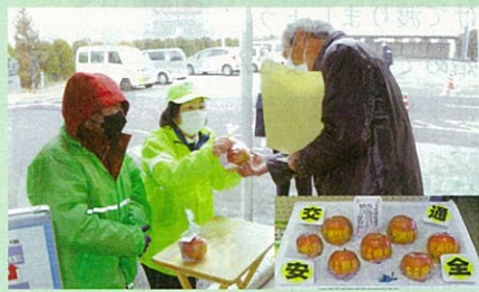
東信運転免許センターにおいて、運転免許更新者に対して「交通安全文字入りりんご」を配付して交通事故防止を指導した。(川西)