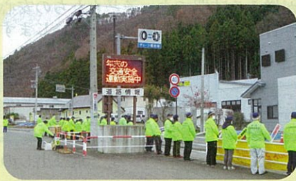
「年末の交通安全運動」に伴い高山村で街頭活動を実施した。(須高)