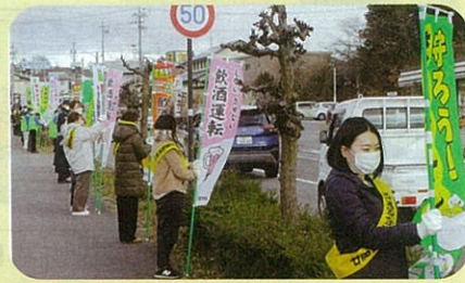
「年末の交通安全運動」に伴い御代田町町内において飲酒運転防止などを呼び掛けた。(佐久)