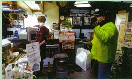
「年末の交通安全運動」に伴い飲食店を対象とした「飲酒運転防止パトロール」を実施した。(木曾)