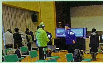
市内の公共施設において、交通安全教育車搭載器材活用による交通安全教室を開催した。(伊那)