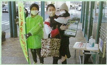
「年末の交通安全運動」に伴い管内のショッピングセンターにおいてピカピカベッタコ作戦を実施した。(小諾)