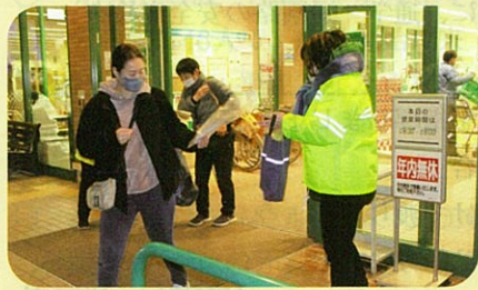
「年末の交通安全運動」に伴い管内のショッピングセンターにおいてピカピカベッタコ作戦を実施した。(依田窪)