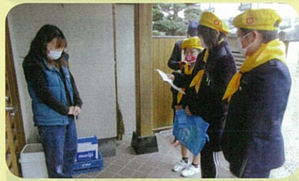
交通少年団が市内の高齢者宅を訪問し、交通安全を呼び掛ける啓発活動を実施した。(飯伊)