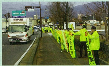
「年末の交通安全運動」に伴い松代大橋前県道で街頭活動を実施した。(長野南・松代)