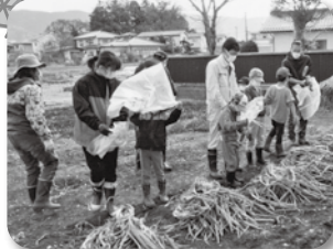
●食育講座 松本一本ネギの収穫