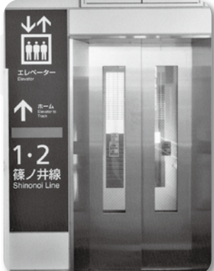
●南松本駅のエレベーター 使用開始(10月28日)