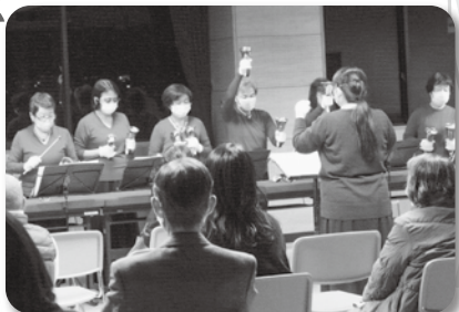
●イルミネーション点灯式 今年もBell/ハミングの演奏