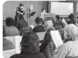
●ふれあい健康教室 夕々に歌声が戻る