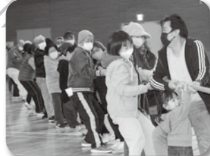
●健康まつり松南 3年ぶりに復活