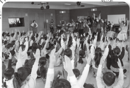
●開明小学校2年生と福祉ひろばの交流会