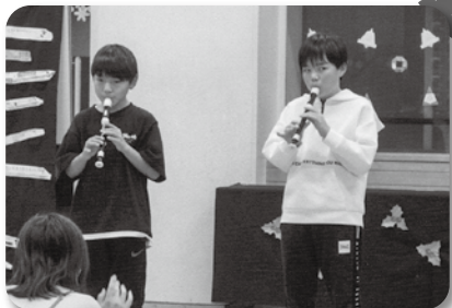
●南部児童センター クリスマスコンサート