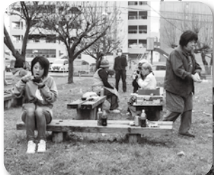
●毎年恒例の焼きいも大会! 豚汁・モツ煮も加え、皆、笑顔に(双葉南町会)