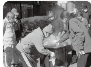
●炊き出し訓練 豚汁で子ども食堂