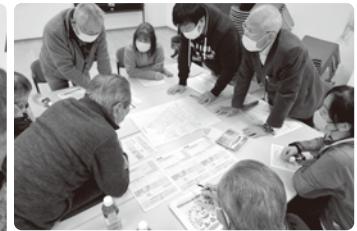
◀町会ごとでのマップ作り

「ささえあいマップ」の作成は始まったばかりです。今後、町会ごとに内容を充実させながら見直しを掛けていきます。このマップは平時の見守りにも活用できますが、名簿とマップは大切な個人情報が含まれているため、管理を含めた運用方法も検討を重ねていく予定です。災害発生時には今元気な人達も、けがなどにより支援される立場になるかもしれません。いざという時に、少しでも被害が少なく、多くの人が安全な環境に避難できるように、みんなで知恵を出し合って備えていきましょう！