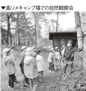
▼高ソメキャンプ場での自然観察会