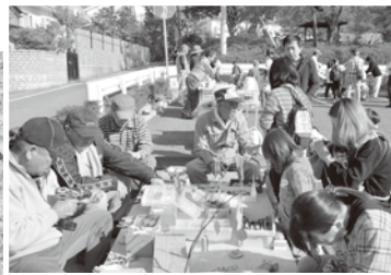
▲間伐材を使った工作教室