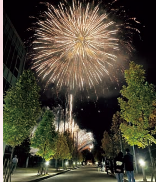
フィナーレを飾った花火大会

来年度、どのような梓乃森祭になるのかわかりませんが、今年の経験を活かし、さらなる発展を期待できると考えているのは私だけではないと思います。学祭局メンバー、参加した学生、教職員の方々に感謝申し上げるとともに、『来年こそ!!』を祈念して…。