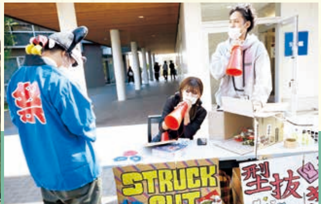
笑顔が集った「梓乃森祭」が3年ぶりに対面で開催(詳しくはP.12をご覧ください)