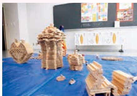
バラエティ豊かな展示が多く並びました