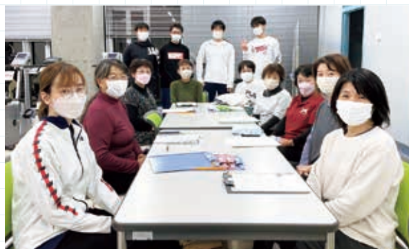
講座の参加者と山本ゼミの学生たち