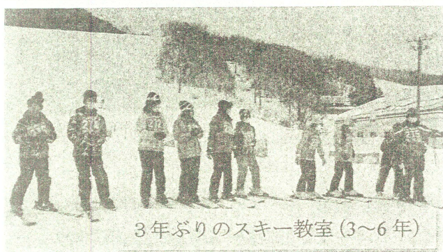
3年ぶりのスキー教室(3~6年)