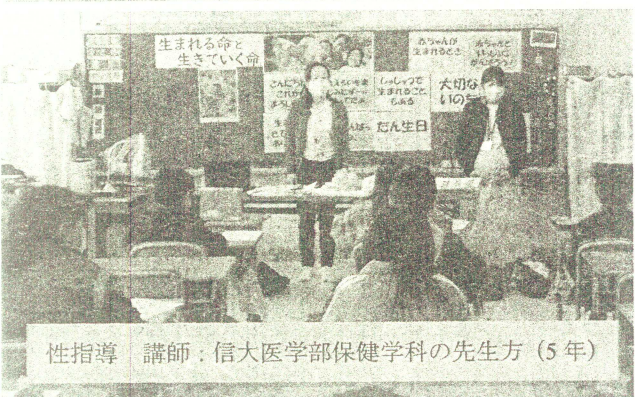
性指導 講師：信大医学部保健学科の先生方(5年)