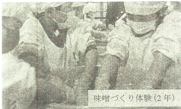
味噌づくり体験(2年)