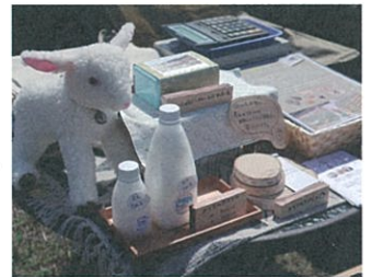
写真は昨年の様子です

フリーマーケットやキッチンカーの出店、和太鼓の演奏なども…ぜひ会場までお越しください!