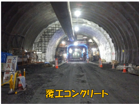
覆工コンクリート

今後も引き続き、安全に留意しながら工事をすすめて参りますので、何卒ご協力をよろしくお願い申し上げます。