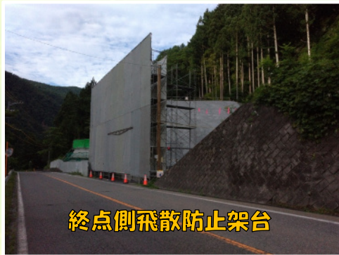
終点側飛散防止架台