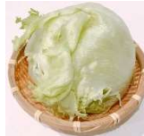
⑤レタス 【 】