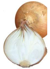
⑧たまねぎ 【 】