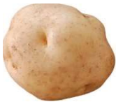
②じゃがいも 【 】