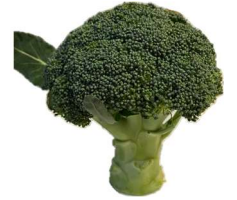
⑨ブロッコリー 【 】

した しゃしん やさい は はな くき み ね 下の写真の野菜は、葉・花・茎・実・根のうちどの部分なのか、考えてみましょう。