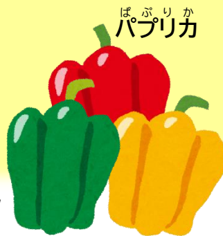
ぱぷりか パプリカ