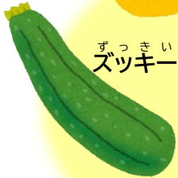
ずっきーに ズッキーニ