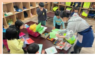
大切な人へのプレゼントづくり

*児童館・児童センターは0歳～18歳まで自由に利用することができます。お気軽にお出かけください。また、利用者の皆様の相談を受ける窓口を設けています。お子さんの成長や接し方、その他、生活していくうえで困りの事など、何でもご相談ください。少しの事でもお気軽にお越しください。