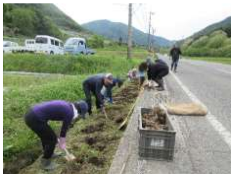
5.25 県道沿いにダリアを植栽