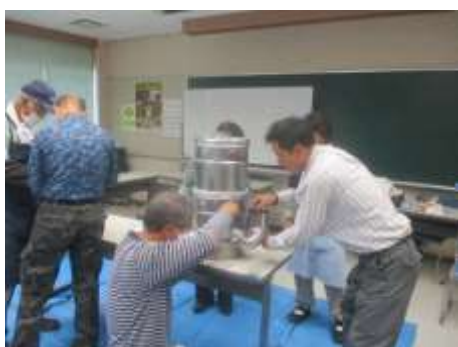
7.23 ロケットストーブ製作体験会