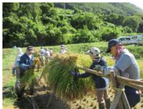
9.9 田んぼのわ 稲刈り・はぜ掛け