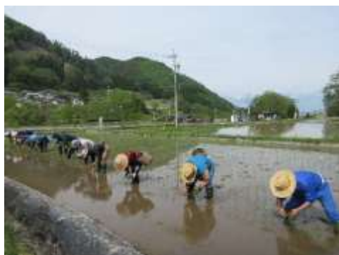
5.13 田んぼのわ 田植え