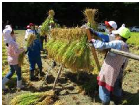
9.5 山辺小学校体験学習 稲刈り・はぜ掛け