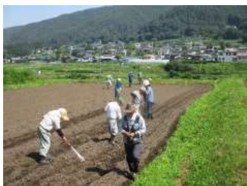
7.22 そば 種まき