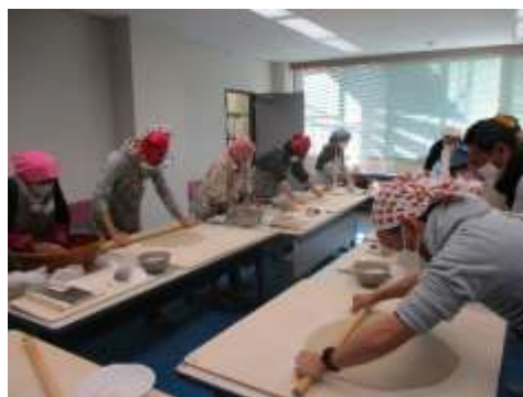
12.3 そば打ち講座(入山辺公民館と共催)