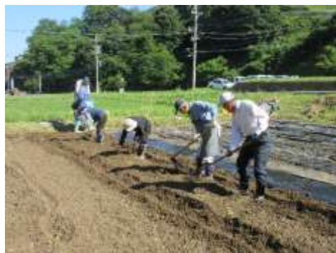
県道沿いの畑へ花植え