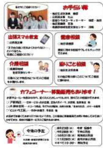
(福祉を考える集い)