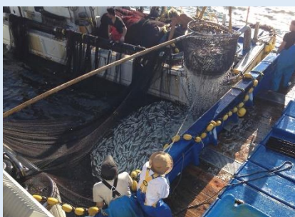
あじ みずあ ようす アジの水揚げの様子

あじ かんじ か 「アジ」を漢字で書くと… 魚 + 参 = あじ 鯷 おいしすぎて、参 (まい) ってしまう (こま 困ってしまう) こと からこの漢字 (かんじ) になったそうです