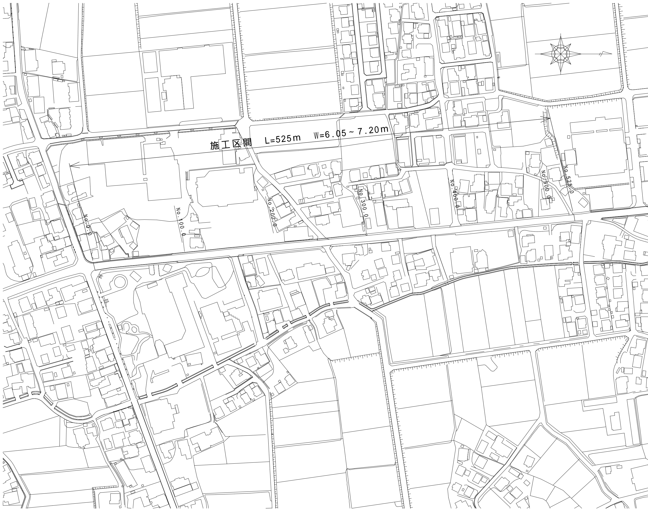
平面図 S = 1 : 2000