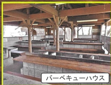
バーベキューハウス

セットメニューには食材・タレ・備品「炭・網・取り皿・割り箸・コップ・焼きそば用プレート」施設使用料が含まれます。(備品・タレ等の追加は別途料金が発生致します)