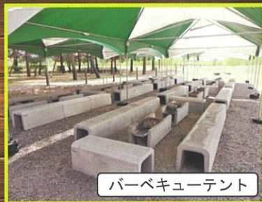
バーベキューテント