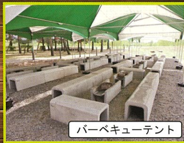
バーベキューテント