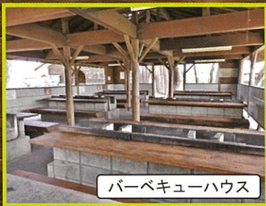
バーベキューハウス

セットメニューには食材・タレ・備品「炭・網・取り皿・割り箸・コップ・焼きそば用プレート」施設使用料が含まれます。(備品・タレ等の追加は別途料金が発生致します)