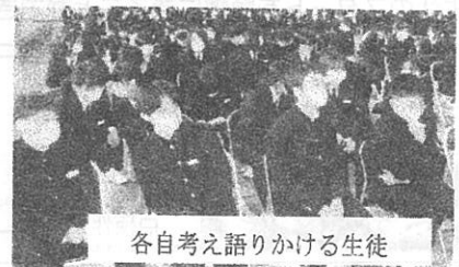
各自考え語りかける生徒

ぼくは、その通りだと思います。家族ではあまりできない。たくさん友だちがいる学校だからこそできることだと思います。