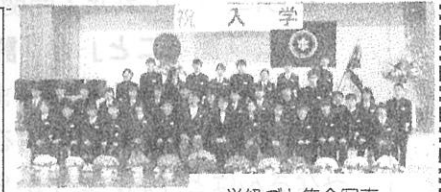
学級ごと集合写真

本年度の入学式は、新入生・保護者・職員で4月4日に行いました。新しい制服に身を包み緊張した面持ちで144名の新入生が体育館に入場し、滞りなく式を終えることができました。式に引き続いて、各学級において、学級担任による学活が行われ、中学校生活のスタートを順調にきることができました。