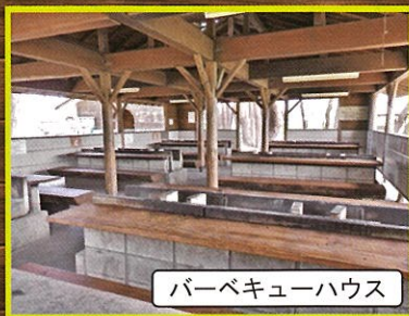
バーベキューハウス

セットメニューには食材・タレ・備品「炭・網・取り皿・割り箸・コップ・焼きそば用プレート」施設使用料が含まれます。(備品・タレ等の追加は別途料金が発生致します)