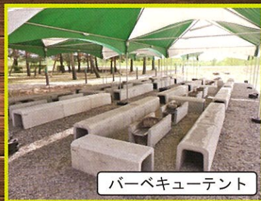
バーベキューテント