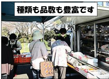
種類も品数も豊富です