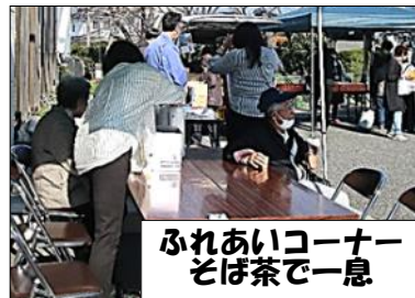
ふれあいコーナー そば茶で一息

会場に能登半島地震の義援金や緑の募金の募金箱を設置したところ開催時間だけで7000円以上の募金がありました。ご協力ありがとうございました。