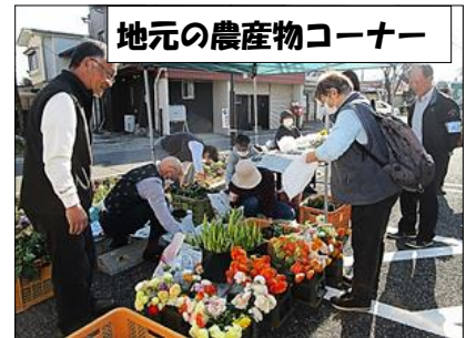
地元の農産物コーナー