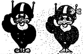
長野県警察シンボルマスコット「ライボくん ライビィちゃん」