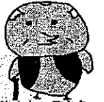
電話でお金詐欺防止キャラクター