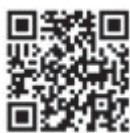
「なおして!アルプちゃん」 iOS端末用