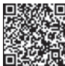
「なおして!アルプちゃん」 Android用