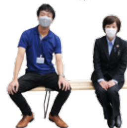
試作のベンチ（上）とベンチに座る三の丸倶楽部のメンバー