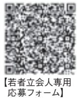
【若者立会人専用応募フォーム】

0円（予定） 申・固 1月6日(月)から選挙管理委員会事務局（東4） 34-32 30 ☎39 1160 ～