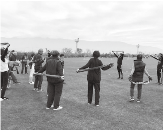
松本山雅「青空健康教室」の様子

アウェイサポーターへのアンケートでは、「松本の人はとても親切」「おもてなしに感動した」「アウェイに来てここまで歓迎されるのは初めて」といった声が聞かれ、おもてなしが松本の魅力の一