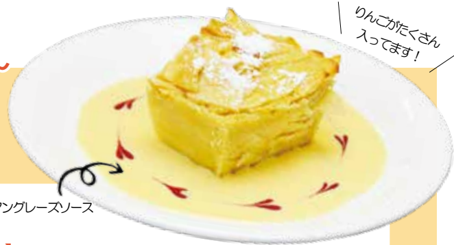
アングレースソース