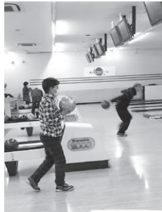
一投ごとに一喜一憂

2月10日(土)、今井地区スポーツ協会主催により梓川のCOCOLINEにて行われました。町会や世代が様々な23名が参加し、2ゲームを楽しみました。 ボウリング後には梓水苑にて新年会も行われ、終始笑顔で会話も弾み、大満足の楽しい一日となりました。