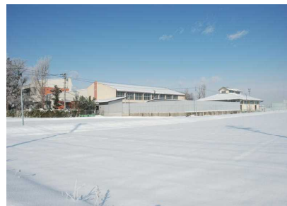
〈赤い屋根が、まっ白！〉

学校内の除雪や氷の除去につきましては、職員や生徒が朝や清掃の時間に取り組んでいます。学校外の通学路については、市の除雪計画のもと各家庭や地域の皆様の善意に頼るしかありません。ご支援を心よりお願い申し上げます。