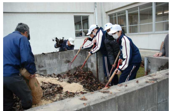
〈環境整備への支援～堆肥づくり！〉