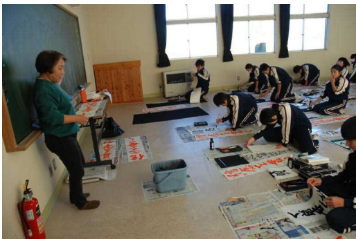
〈書道の授業への支援〉

地域の方からご支援をいただき、11月上旬落ち葉積み作業が行われました。また、12月には書き初め指導を受けました。「生徒の皆さんの吸収が早いので、とても教えがいがありました。」など、嬉しい感想を講師の方からいただきました。