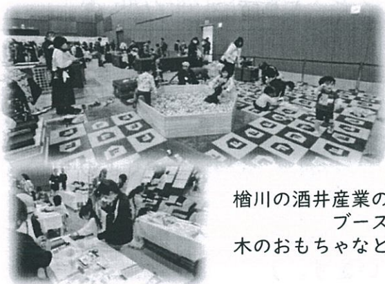
檜川の酒井産業の ブース 木のおもちゃなど