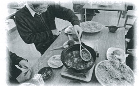
とうじそばを伝承する