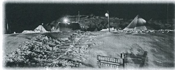
人気のもっくの冬キャンプ