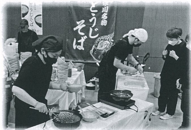
グリーンコープと共同開発の 奈川在来の冷凍そばを使ったとうじそば