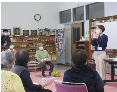
3月のふれ健「フレイル予防講話」の様子

※ 保健師・包括支援センター職員が秘密厳守で対応します。どんなことでもご相談ください。