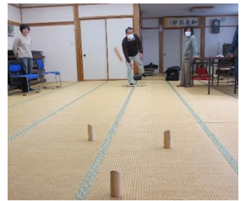
「出張ミニふれ健」でゲーム(モルック)をする様子(曾倉・入山)