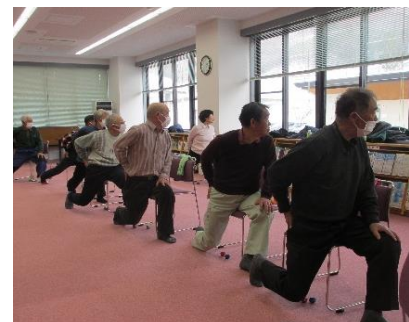
3月の「男しよの体力講座」の様子