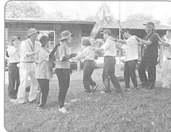
指導者スキルアップ研修会

各地区での身近な緑化活動や、 森林ボランティア団体等を対象とする公募事業、 みどりの少年団の育成などに活用しています。