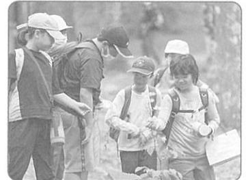
みどりの少年団交流集会